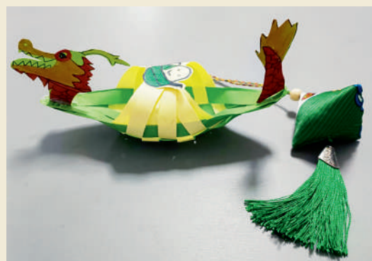
《端午龙舟》 杨皓儒 9岁 孩子说:端午节,我创造了一艘绿色的龙舟,上面小小的粽子,象征着对屈原的怀念。而那个香囊,不仅能驱除虫瘟,更能点燃大家对传统文化的热爱。(浙江农合 南会芬)