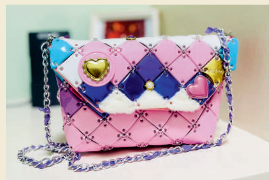
《送给妈妈的时尚背包》 童奕涵 11岁 (明日控股 施蓓)