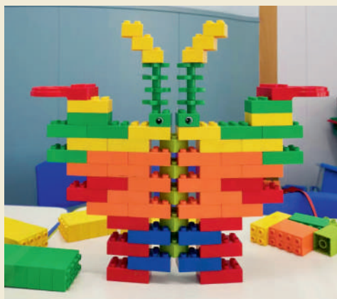
《蝴蝶积木》 李十一 3岁 蝴蝶翩翩起舞,色彩斑斓,点缀着夏日的花园,充满快乐。(明日控股 刘诗梦)