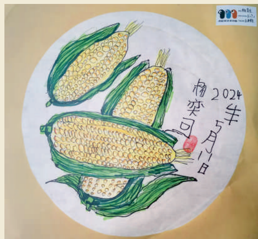
《玉米写生》 杨奕可 7岁 (浙农金泰 杨成良)