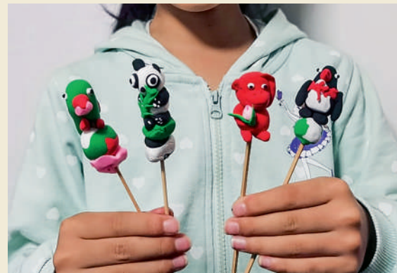
《泥塑》 徐天亦 8岁 孩子说:泥塑真是太有趣了,很想捏,根本停不下来!(金昌汽车 宋璐)