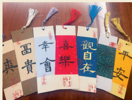
《端午节灯笼》 钱亿凡 10岁 (浙农实业 俞怡闻)