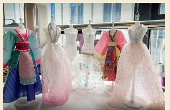
《礼服》 陈景惠 9岁 孩子说:我梦想有一天穿上自己设计的礼服成为时尚达人,也想穿上自己制作的中国汉服,传播中国的古典美。看着一件件我想象中的小礼服变成现实,虽然还不是最漂亮的,但它们都是我自己动手做的,我感到特别自豪。(石原金牛 陈彦玲)