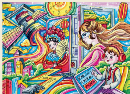
《穿越》 张伊诺 12岁 假如我能坐着时光穿梭机回到古代,我想去探究传统的京剧艺术和古代建筑,了解中国文化的精髓,让中国古代的艺术更好地传承;如果能坐着时光穿梭机去到未来,我想去探索未来的科技世界,感受科技发展给世界带来的无尽变化,去见证我国科技的崛起。(石原金牛 洪雨丽)